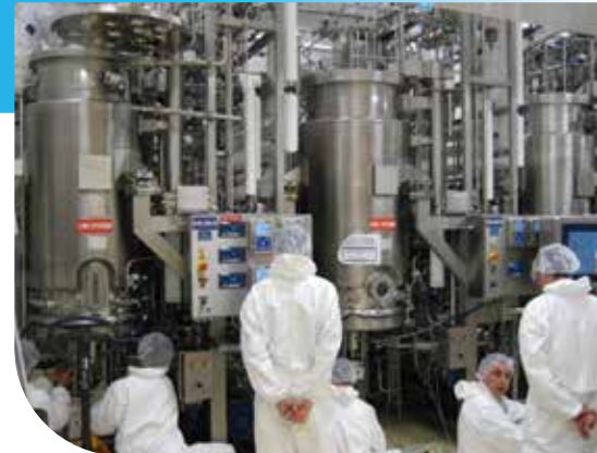
Technische Bestandsaufnahme vor Ort

Eine weitere Herausforderung an die Entwicklung von Dichtungslösungen für die Pharmaindustrie und insbesondere für die Produktion von Biopharmazeutika ist die überschaubare Anzahl der zugelassenen Hilfsstoffe als Sperrmedium. Für das Abdichten der Welle des Rührwerks kam im Fall des Fermenters lediglich ein Dampfkondensat, das heißt, hochreines Wasser, in Frage.